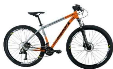
MTB 29 Laranja/Cinza