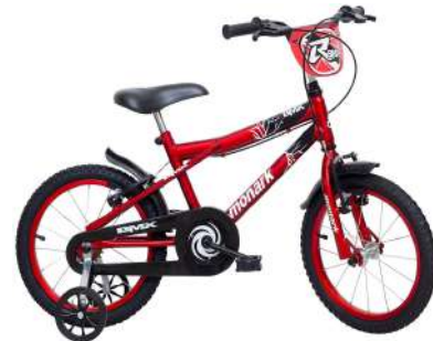
BMX R Aro 16