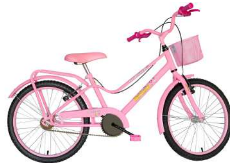
Brisa Aro 20