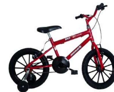
BMX Aro 16