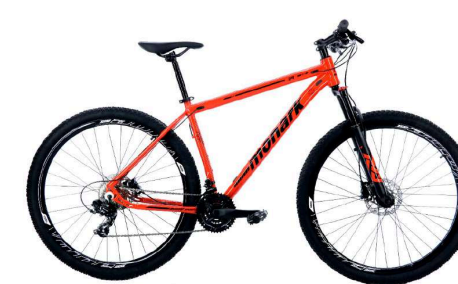
MTB 29 Vermelha - Tam. 17,5