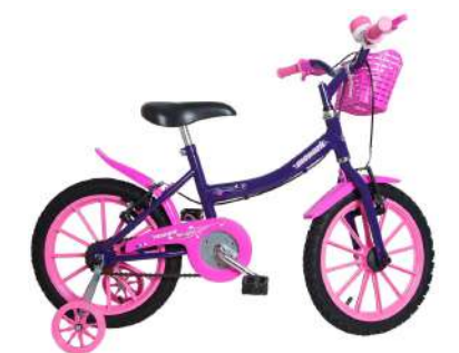
Kids Aro 16