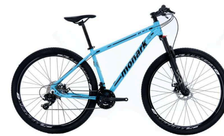
MTB 29 Azul