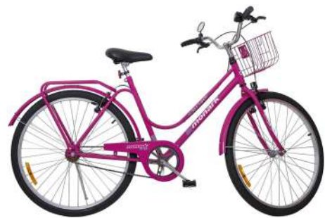
Brisa Aro 26