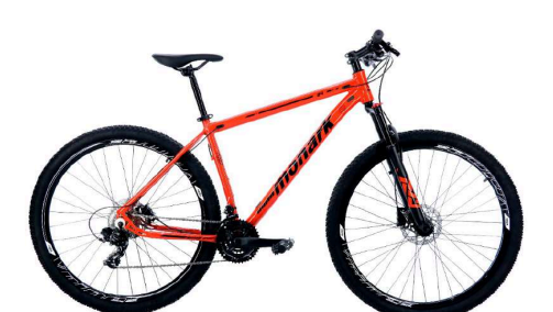
MTB 29 Vermelha - Tam. 19