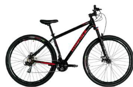
MTB 29 Preta