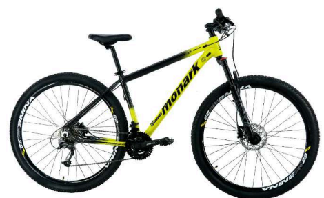
MTB 29 Grafite/Amarela