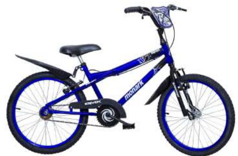
BMX R Aro 20