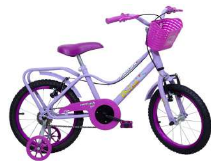
Brisa Aro 16