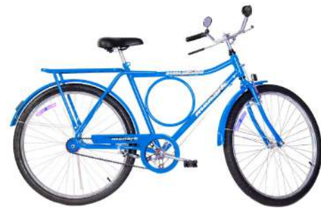
Barra Circular FI