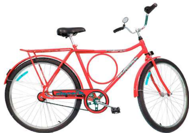
Barra Circular FI