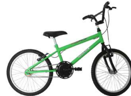
BMX Aro 20